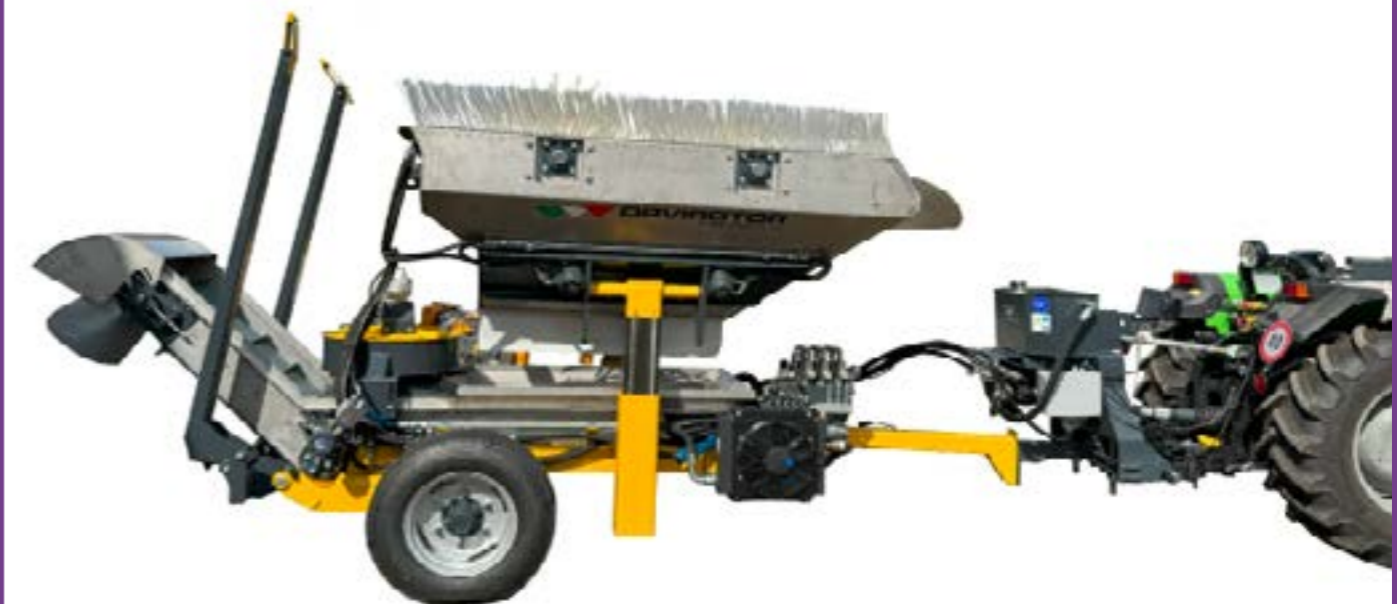
Ejemplo de enganche a tractor